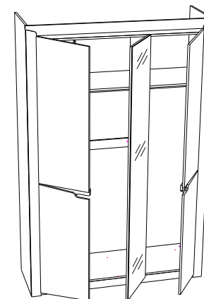
ЛДСП 16мм Ясень Таормино / ЛДСП 16мм Дуб Галифакс