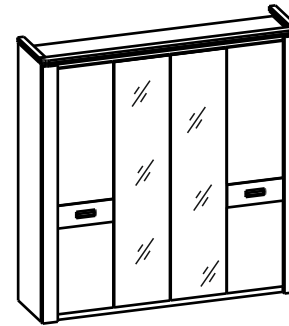
Фурнитура (Упаковка №3)